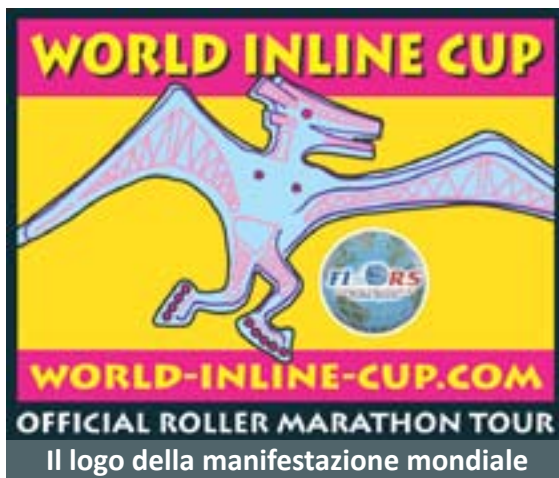
Il logo della manifestazione mondiale

alti livelli sin da subito, è stato l'anno forse più duro della mia carriera sportiva, 2 allenamenti al giorno, problemi con il piede, con le viti necessarie per ricomporre l'osso, ho stretto i denti e sono arrivata quarta. Il 2009 è stato l'anno in cui posso dire di aver fatto delle ottime gare ma di non essere soddisfatta, perché non riuscivo a divertirmi, perché ero entrata a far parte del team più forte al mondo, ma dove